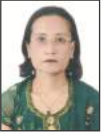
रत्नतारा ताम्राकार, महाबू, येँ

भी नेवाः धइपिं तजिलजि, धार्मिक, ऐतिहासिक जक मखु, भाषा, लिपि, साहित्य नृत्य इत्यादि थज्याःगु ज्याय् न तसकं न्ह्याःपिं, तःमि, नाजाःपिं छू जाति व समुदाय खः । थ्व खँ दुवाला स्वयंबलय् नखःचखः, जात्रा, पर्व, मेला, इलय्-ब्यलय् हुइकाः क्यनावःगु सांस्कृतिक प्याखं, थीथी ताजिया बाजं थानाः वयाच्वंगुलिं प्रष्ट जुइ । बाजं व बाजं ज्वलंया खँय् मेपिं जाति स्वयाः च्वन्ह्याः । न्यनेदुकथं नेवाःतसें छ्यलीगु बाजंया ताजि जक हे सछिं मल्याः धाइ । उकीमध्ये सलंसः दै न्ह्यवःनिसें दैयुदँसं गुंला लच्छिंयकं थाना वयाच्वंगु छू गुंला बाजं खः । गुंला लच्छिंयकं गुंला बाजं थानाः स्वयम्भू त्वाथः गयाः स्वयम्भू चैत्य, थीथी बहाःबहि चाःहिलाः मदिक्क बाजं संस्कार हनावयाच्वंगु धइगु चीधंगु खँ मखु । गुंलाबाहेक थीथी पर्व जात्राया ब्वज्याय् ब्वति कयावःगु धइगु हे नेवाःत 'छ्थी छ्पँ' जुयाः सांस्कृतिक म्हसीका क्वातुक ल्यंका तय्माः धइगु मन क्वसाय्काः संगठित रुपं न्ह्याकाच्वंगुलिं जुइमाः ।