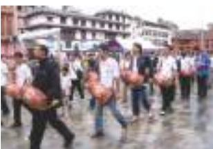
गुंला बाजं रत्नतारा ताम्राकार, महाब, थै - ३