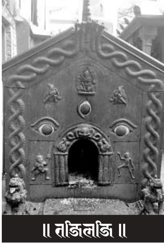
॥ तजिलजि ॥

रुमिग द्याया कहे ज्ञाया ज्ञाया मनु सीवलतय् अइध धयाहे ह्यैय ह सिक्कग याळ । डवलतय् आइहे स्वास्त्रा संस्त्रा, अस्थताल आदि यक्क मड । सुं नं कं मयासां ह्यैय ह तयाइ वासइ याळ । डाक्कन वेइ आदि क्कनमाइसां ह्यैय ह हनादयाइ क्कनग याळ । मडिमगाइसा जक अस्थताल यंकग याळ । वासइ दानां मलाळ हं हन धाइसा ह्यैय ह नं लिततइग याळ । ह्यासय्