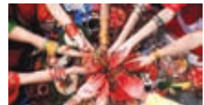
अपसं चवना: धर्म लाइ - ३